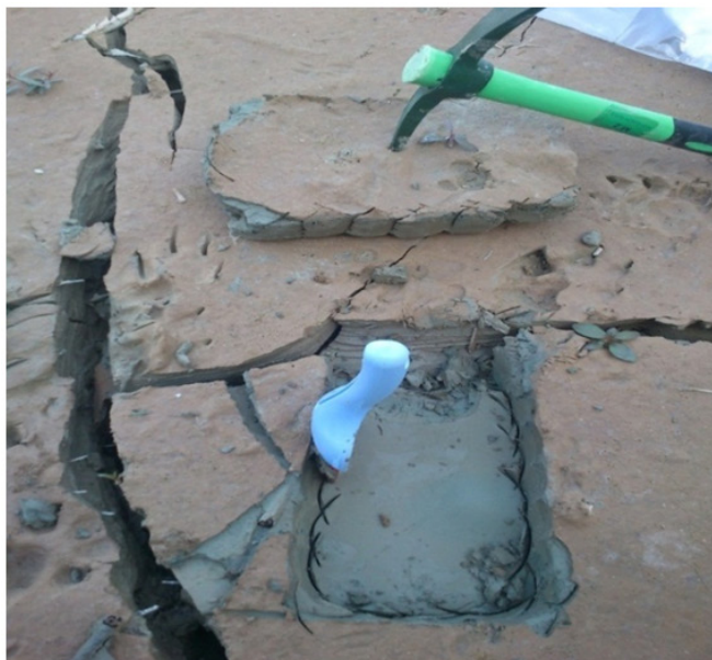
شکل ۴-نمایی از برداشت نمونه خاک در مخزن یک