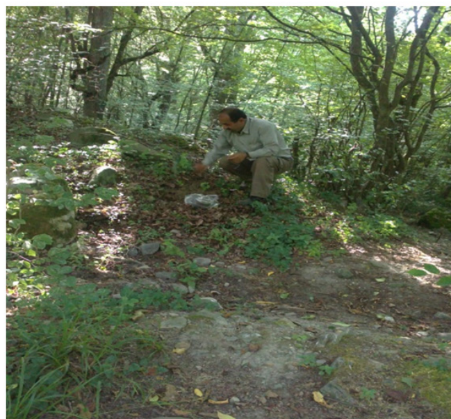
شکل ۳-نمایی از برداشت نمونه خاک در منابع رسوب

از محلول استتات سدیم و دستگاه حمام بنماری مواد چسبنده از جمله مواد آهکی نمونه‌ها جدا شد. سپس با استفاده از آب اکسیژنه مواد آلی جدا گردید. پس از این مرحله با استفاده از محلول بافر سیترات و دیتیونایت مواد آهن‌دار نمونه‌ها حذف گردیده و در نهایت با استفاده از دستگاه سانتریفیوژ رس نمونه‌ها جهت قرائت توسط دستگاه XRD بدست آمد. قرائت نمونه‌ها تحت اعمال ۴ تیمار اشباع با پتاسیم، اشباع با پتاسیم به علاوه حرارت ۵۵۰ درجه، اشباع با منیزیم و اشباع با منیزیم به علاوه اتیلن گلیکول انجام گرفت. با استفاده از قرائت دستگاه از نمونه‌ها و پیک نمودارهای حاصل از این ۴ تیمار برای هر نمونه، نوع کانی‌های موجود در نمونه‌ها به خوبی مشخص گردید.