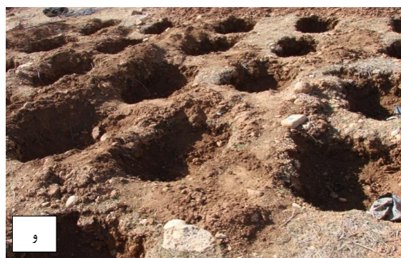
شکل ۲- آماده سازی بستر کاشت: الف- نمای عمومی طرح، ب- چاله‌ی کاسه‌بی، ج- سکو، د- جویچه، و- چاله‌ی مستطیلی.